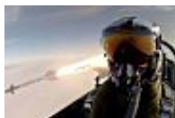
PHOTO. Avion de chasse: un pilote danois se tire le portrait... alors qu'il...